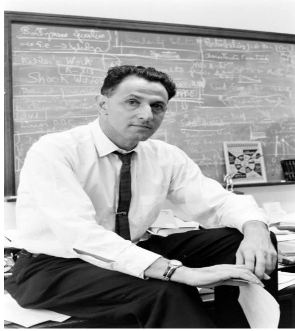
ريتشارد بيلمان (1920-1984)

ولد ريتشارد بيلمان Richard Bellman يوم 26 أغسطس 1920 بنيويورك. وعند الانتهاء من دراسته الجامعية في جامعة بالتيمور Baltimore، شغل في البداية منصب مدرب في الجيش قبل أن يلتحق